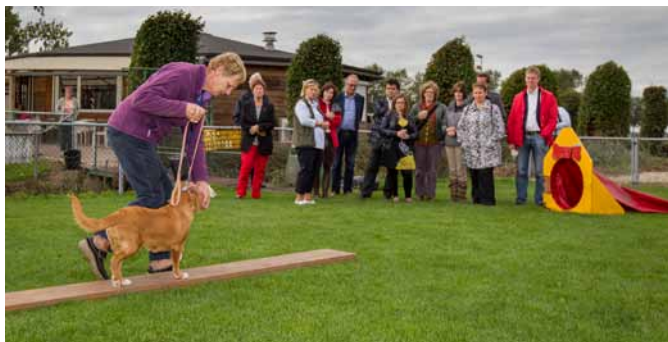
Aandacht voor positieve opvoeding bij KC Gorinchem.

Het bezoek van de medewerkers van het ministerie werd afgesloten met een ontvangst door de Kynologen Club Gorinchem en Omstreken. Deze club gaf diverse demonstraties, onder andere behendigheid en gedrag & gehoorzaamheid.