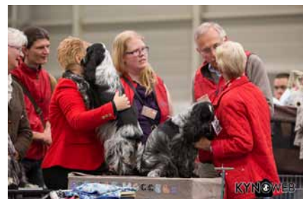
Het Honden Welzijn Team in gesprek met exposanten.

mogelijke manier bewust te maken van eventueel dieronvriendelijk gedrag. Een Honden Welzijn Team is geen hondenpolitie, maar bestaat uit mensen die oog hebben voor hondenwelzijn. Op de oproep zich aan te melden als lid van zo'n team is erg goed gereageerd en veel mensen hebben zich aangemeld.