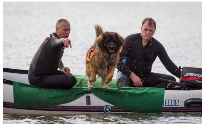
Volop mooie actie tijdens de waterwerk demonstratie.

In samenwerking met de Raad van Beheer introduceerden de beide rasverenigingen voor de Newfoundland de internationale manier van waterwerken in Nederland. Inmiddels is, in samenwerking met de rasverenigingen voor de Landseer ECT en de Leonberger, een reglement vorm gegeven dat leidt tot het beoefenen van waterwerktrainingen, die moeten resulteren in het behalen van internationale, door de FCI erkende, waterwerk brevetten. In dit waterwerk reglement wordt de uiterste zorg besteed aan de gezondheid en het welzijn van de honden die aan het waterwerk deelnemen.