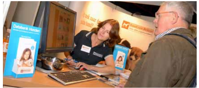
Medewerkers van de Raad van Beheer adviseren potentiële pupkopers.

de rasverenigingen voor meer informatie via het speciale 'Rashonden Informatie Service'-kaartje, waarop de gegevens van de rasverenigingen konden worden ingevuld. De deelnemende rasverenigingen waren dan ook enthousiast over de deelname aan de 50 Plus Beurs en de mogelijkheid om hun ras te promoten.