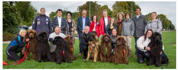
De delegatie van het ministerie, de Raad van Beheer en de honden en begeleiders van de waterwerk demonstratie.

Bij 'De Hoefstal' is uitgebreid over fokken en tentoonstellen gesproken. Het tweede deel van het programma belichtte het werk dat door rashonden kan worden gedaan. Buiten de Waterpoort in Gorinchem kreeg men een demonstratie waterwerk met honden.