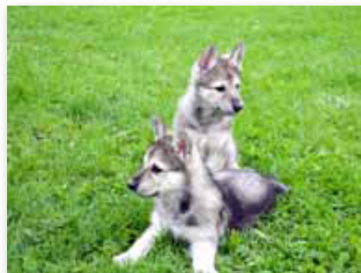
Pups Saarlooswolfhond Outcross.

Maximaal twee pups uit dit outcrossnest, die op alle beoordelingspunten het hoogst scoren, zullen later worden ingezet in een terugkruising met een Saarlooswolfhond.