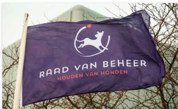
De nieuwe vlag in top bij het Spant!