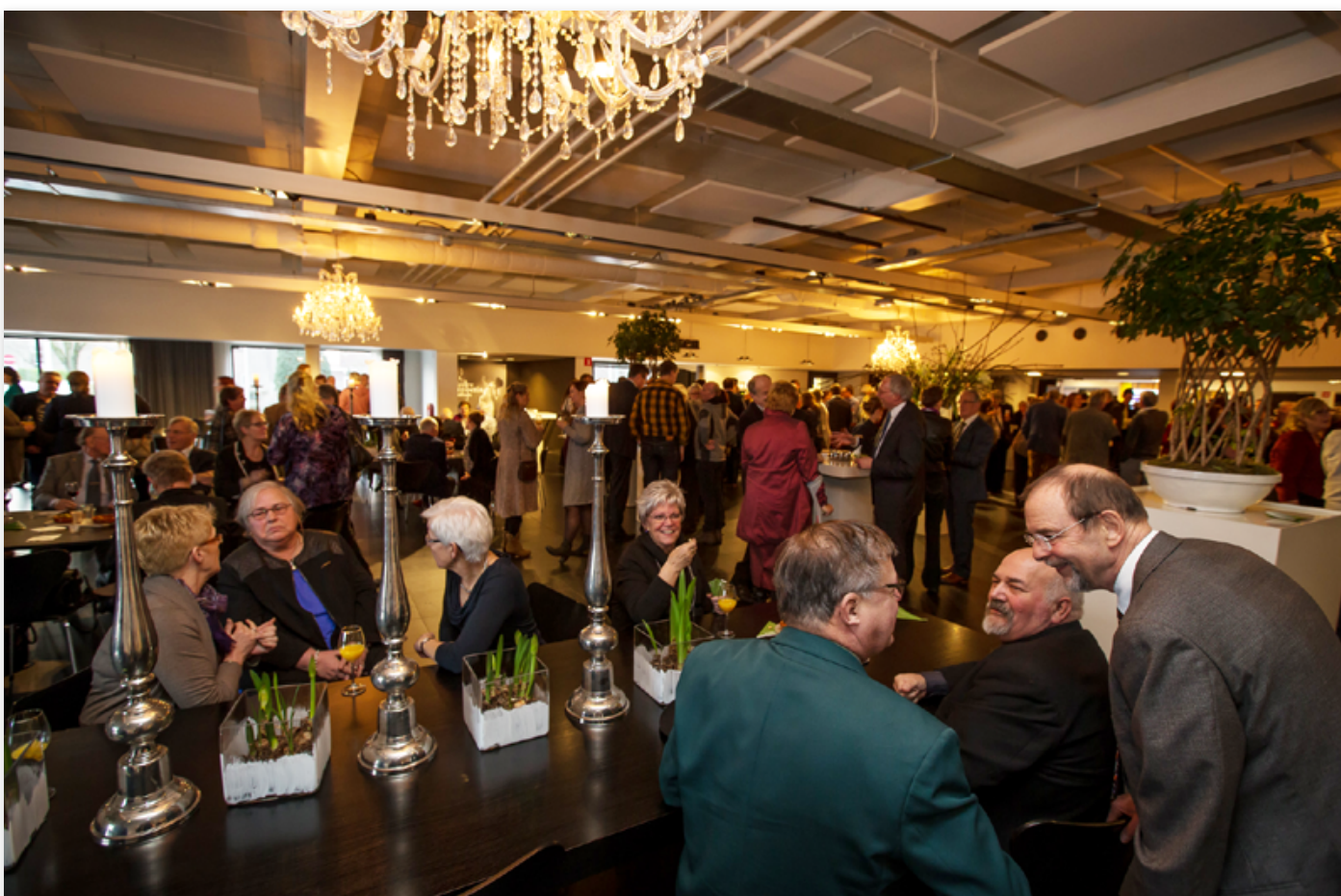
Een vol plein met bezoekers in het Spant! Met 350 bezoekers bijna een verdubbeling van het normale aantal bezoekers.