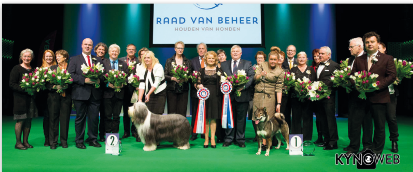
De organisatie, partners, keurmeesters en winnende honden van de Hond van het Jaar 2013 Show.

In 'De Flint' in Amersfoort vond op zondag 11 januari jl. de jaarlijkse Hond van het Jaar Show plaats, georganiseerd door de Raad van Beheer, Cynophilia, Eukanuba, het maandblad Onze Hond en Kynoweb. Met 267 deelnemende honden en een spannende titelstrijd werd het weer een mooi evenement.