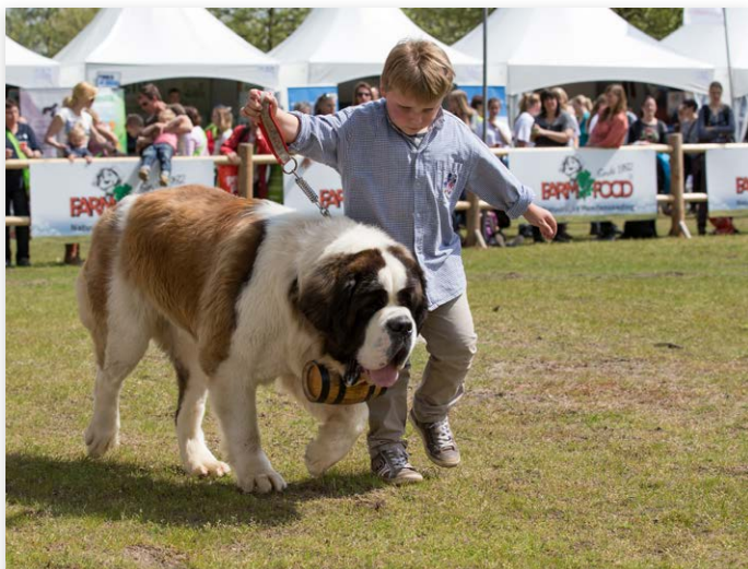
Raad van Beheer Youth is ook aanwezig op Animal Event

Niet vergeten: de Raad van Beheer staat met een grote stand op de tiende editie van Animal Event, dat van 6 – 8 mei in de Beekse Bergen te Hilvarenbeek wordt gehouden. Ook dit jaar organiseren wij activiteiten in samenwerking met circa 25 aangesloten rasverenigingen. Een echte aanrader!