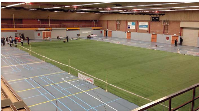
In de Jan Massinkhal lag op 9 en 10 april kunstgras op de vloer, net zoals straks op het WK

Er werd gestart met een vast parkoers door medium,