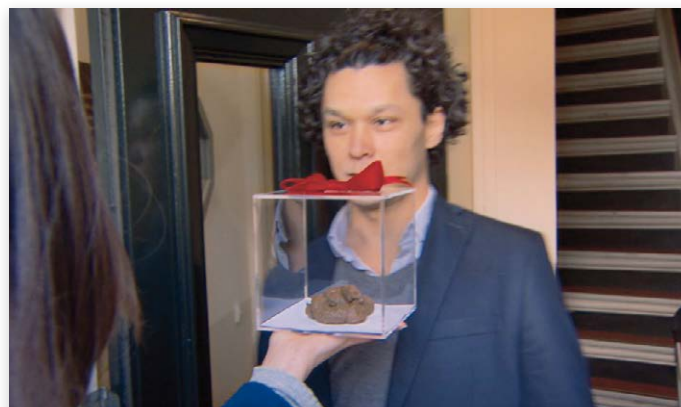
Beeld uit een van de #Tjakarma-spotjes...

De Koninklijke Hondenbescherming roept gemeenten op het de hondenbezitter makkelijker te maken poep