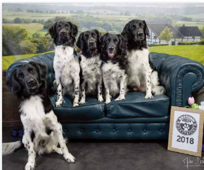
Met deze vrolijke foto promoveerde de organisatie het evenement

De stichting Honden Tentoonstelling Maastricht (HTM) organiseerde op zaterdag 29 en zondag 30 september 2018 haar 40e en 41e internationale hondententoonstelling in het MECC te Maastricht. Onder invloed van de grote World Dog Show in Amsterdam en de European Dog Show in Polen werden er minder honden ingeschreven dan vorig jaar. Toch waren er nog 3.250 honden uit veertien landen naar Maastricht getogen.