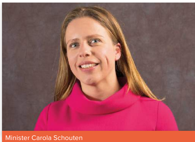
Minister Carola Schouten

Het paspoort wordt verplicht voor alle nieuwgeboren en geïmporteerde honden en bevat gegevens over de herkomst van de hond, medische informatie en eventuele eerdere eigenaren. Zo helpt het paspoort malafide fokkers en importeurs op te sporen die dit soort zaken niet geregeld hebben. Zij riskeren dan een boete of dwangsom. Jaarlijks worden er zo'n 150.000 honden aangeschaft, waarvan er ongeveer 50.000 uit het buitenland komen. Onder deze dieren komen veel welzijns- en gezondheidsproblemen voor. Ze worden vaak te jong en