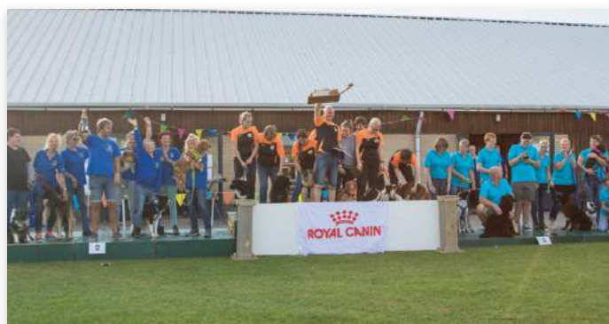
A-Klasse, 1 e Ready to Rumble van KC Delft, 2 e Oase Express van HSV de Oase 3 e Choose to Fly van NVBH

Er was een lichte spanning bij de teams van de B-klasse, omdat nog van alles mogelijk was. Dit in tegenstelling tot de A-klasse waar de podiumplaatsen al vaststonden. De snelste dagtijd in alle klassen kon nog wel verbeterd worden. Dit gebeurde dan ook op de laatste dag door Flying Floaters van KC Hofstad (22.43), en in de A-klasse werd voor de derde keer dit jaar het Nederlands record op scherp gezet door Ready to Rumble van KC Delft. Het nieuwe Nederlandse record staat nu op 19,71 seconden! Aan het einde van het ochtendprogramma kon er na flink rekenwerk van de coaches in de B-klasse duidelijkheid worden gegeven over wie er op het podium zouden komen.