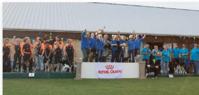
B Klasse, 1 e Oase Horses van HSV de Oase, 2 e Ready to Go van KC Delft en 3 e The Hurricanes van KC Culemborg