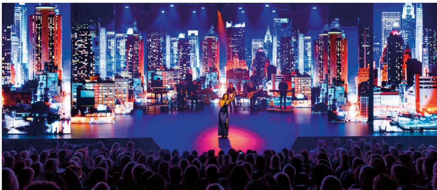
De Dutch Pet Awards worden uitgereikt in een uitermate feestelijke sfeer in de Studio's in Aalsmeer