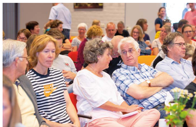
Deelnemers in afwachting van de volgende lezing...