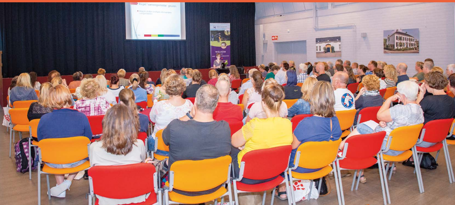
De Dag van de Werkhond trok maar liefst 125 deelnemers