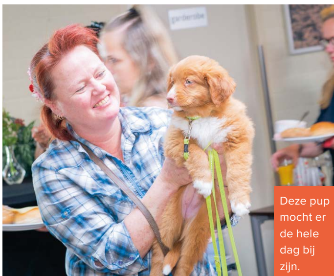
Deze pup mocht er de hele dag bij zijn.