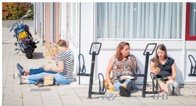
Het prachtige weer trok veel deelnemers naar buiten in de pauze