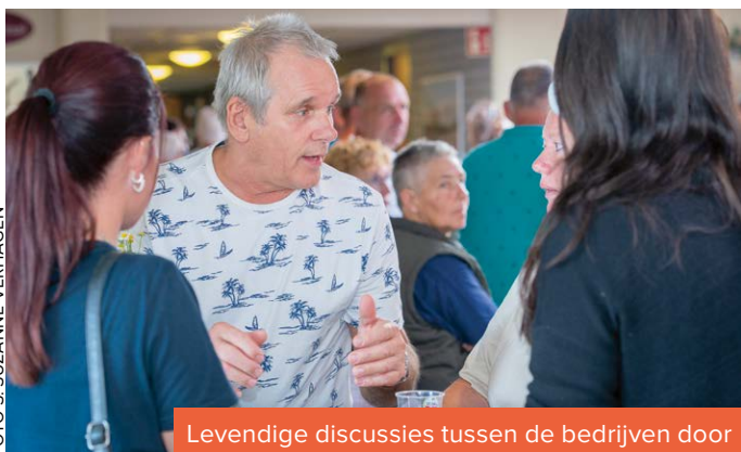
Levendige discussies tussen de bedrijven door