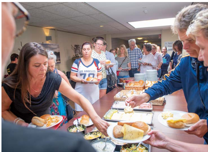
Voor de inwendige mens werd uitermate goed gezorgd