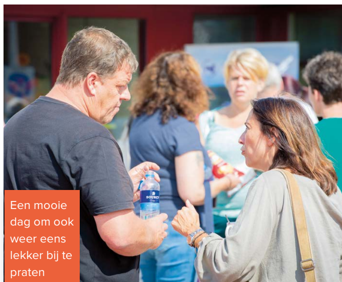
Een mooie dag om ook weer eens lekker bij te praten