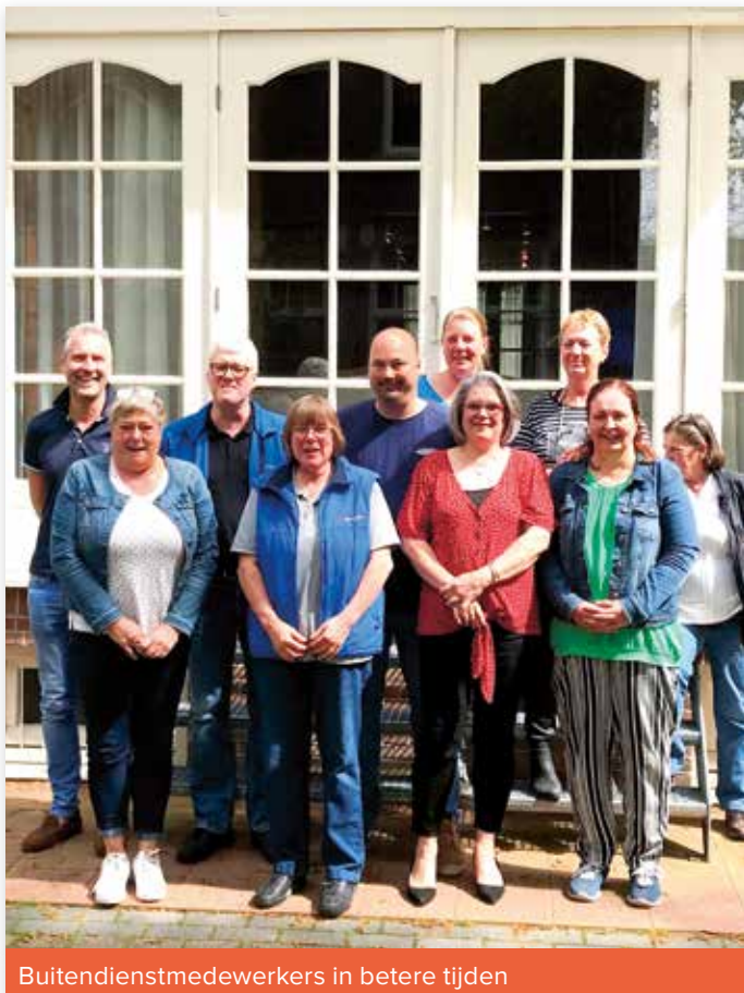
Buitendienstmedewerkers in betere tijden

Een belangrijke en kwetsbare beroepsgroep wordt gevormd door onze buitendienstmedewerkers/chippers. We willen de fokkers de mogelijkheid geven om hun honden netjes te laten identificeren en DNA af te laten nemen. Zo kan de stamboomafgifte doorgaan en kunnen de pups, met de juiste documenten, naar de nieuwe eigenaren. Vooralsnog kiezen we ervoor deze dienst te blijven aanbieden, maar wel met inachtneming van de nodige veiligheidsmaatregelen.