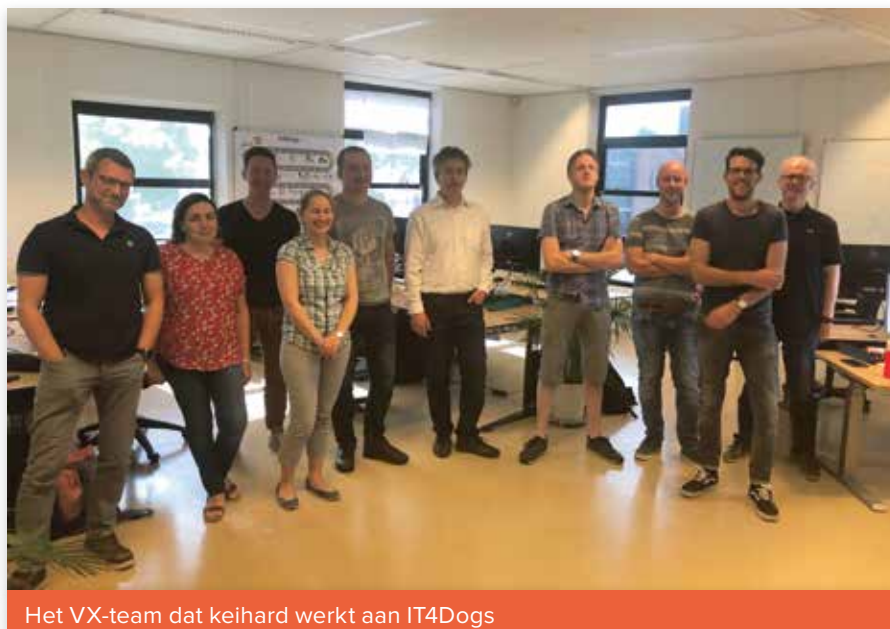
Het VX-team dat keihard werkt aan IT4Dogs

Samen met het softwarebedrijf VX Company hebben we de afgelopen tijd hard verder gebouwd aan IT4Dogs, ons nieuwe IT-systeem. Niet alleen van het softwarebedrijf, waar een team van acht experts continu aan het bouwen is, maar ook van de eigen medewerkers vergt het project de nodige inspanningen. Een zeer omvangrijke klus derhalve, die naar verwachting najaar 2020 zal leiden tot de lancering van het nieuwe systeem.