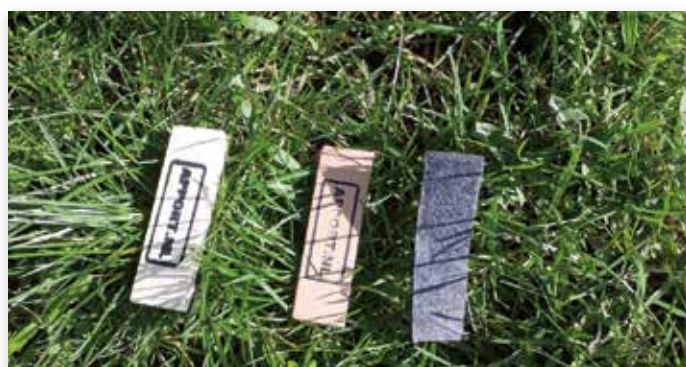
Voor alle deelnemers zijn er drie speurvoorwerpen die ze moeten vinden

Het Corona-virus houdt heel Nederland, dus ook de kynologie, in de greep. Zo moesten voor april en mei alle hondensportevenementen en -trainingen afgezegd worden. Omdat de selectiewedstrijden voor juni zijn gepland, gaan wij er vooralsnog van uit dat het evenement kan doorgaan. Uiteraard volgen wij hierin het advies van de Nederlandse overheid.