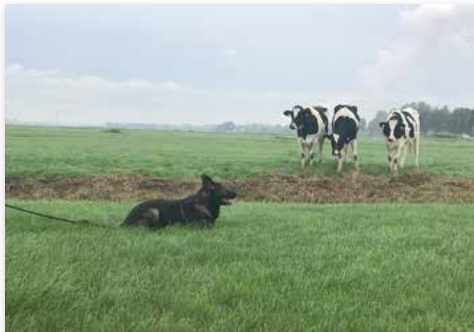
Alvast oefenen met de hond in het grasland...

Ondanks de Coronacrisis gaan de voorbereidingen van FCI 2020, het Wereldkampioenschap voor Werkhonden, gewoon door. De organisatie hoopt dat na 1 juni de selectiewedstrijden alsnog kunnen plaatsvinden. Het WK vindt van 9 tot en met 13 september plaats op sportpark CSV in Apeldoorn. De inschrijving (voor de geselecteerden uit het land van herkomst) is gestart op 23 maart op de website van Caniva