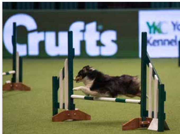
Dutch RePlay werd tweede, meteen achter haar vader...