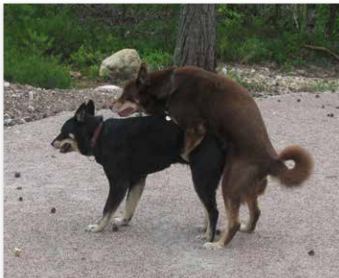
Dit is nog een 'gewone' dekking van Lapinporokoira...

De juridische afdeling van de Raad van Beheer heeft navraag gedaan bij de kennelclubs van de drie landen, uiteindelijk kwam begin juli het verlossende woord: 'Ja, jullie mogen aangekeurde honden die zijn ingeschreven als Lapinporokoira in de stamboeken van de drie Scandinavische landen gebruiken, mits de combinatie de instemming heeft van het Scandia-bestuur en er een motivatie meegestuurd wordt.' Uit contacten hierover met fokkers uit Finland is duidelijk geworden dat het verstandig is om via één van de genoemde keurmeesters het contact te leggen met de eigenaren van deze honden.