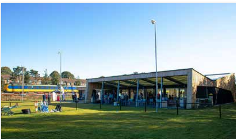
Het terrein van KC Zwolle is uitstekend geschikt voor een outdoor evenement

Dit nieuwe showconcept blijkt te werken. Na het openen van de inschrijvingen was het maximaal aantal in te schrijven honden (400/dag) al snel gehaald.