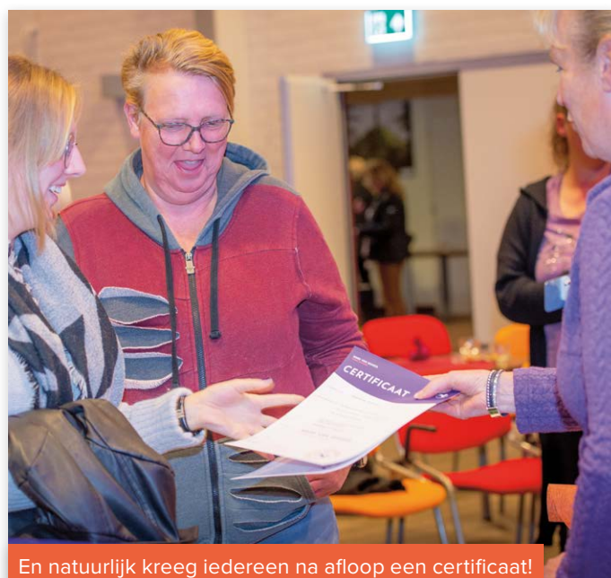
En natuurlijk kreeg iedereen na afloop een certificaat!

De organisatie dankt ook partner Royal Canin. We kunnen met elkaar tevreden terugkijken op een zeer zinvolle en leerzame nascholing. Daarom staat de dag nu al gepland voor zaterdag 20 augustus 2021. Zet alvast in uw agenda!