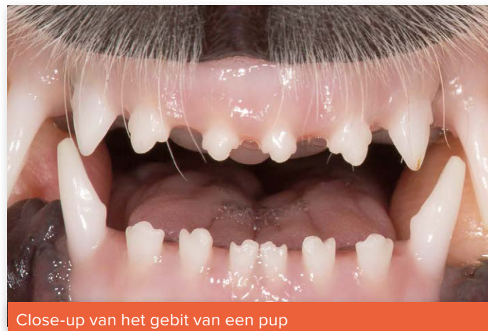
Close-up van het gebit van een pup

Het doel van het onderzoek is het in kaart brengen van de leeftijd waarop bij pups van verschillende rassen de snijtanden doorkomen en wisselen. Aan de hand van de onderzoeksresultaten probeert het expertisecentrum een betrouwbare methode te ontwikkelen voor het inschatten van de leeftijd van een pup. Deelname van honden met een stamboom van de Raad van Beheer is heel waardevol, omdat de geboortedatum van deze dieren betrouwbaar is. Inmiddels is van 200 pups het wisselpatroon in kaart gebracht. Voor een goed beeld van de variatie tussen rassen en binnen een ras zijn nog meer honden nodig.