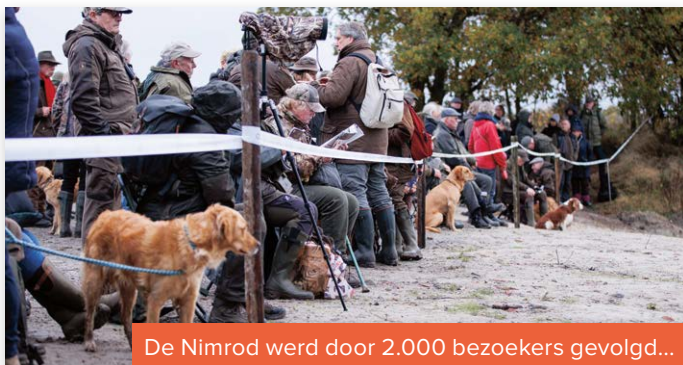
De Nimrod werd door 2.000 bezoekers gevolgd...

Ze moesten proberen tijdens een drietal proeven om alle negen apporten binnen te brengen. De proeven waren afwisselend opgebouwd, waarbij de honden onder meer een lang geurspoor ('sleep') moesten volgen, een apport