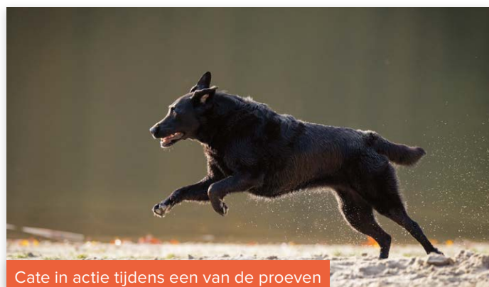
Cate in actie tijdens een van de proeven