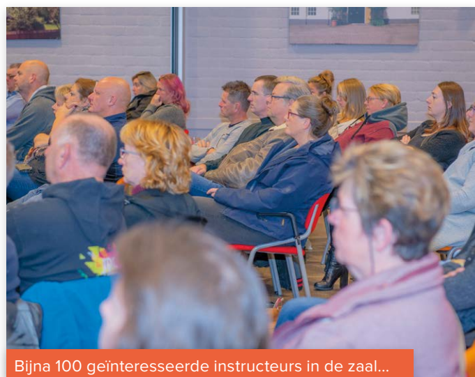
Bijna 100 geïnteresseerde instructeurs in de zaal...

vertaling naar de IGP-sport is toch wat specialistischer. Rapportcijfer inhoud lezing: 7,3.