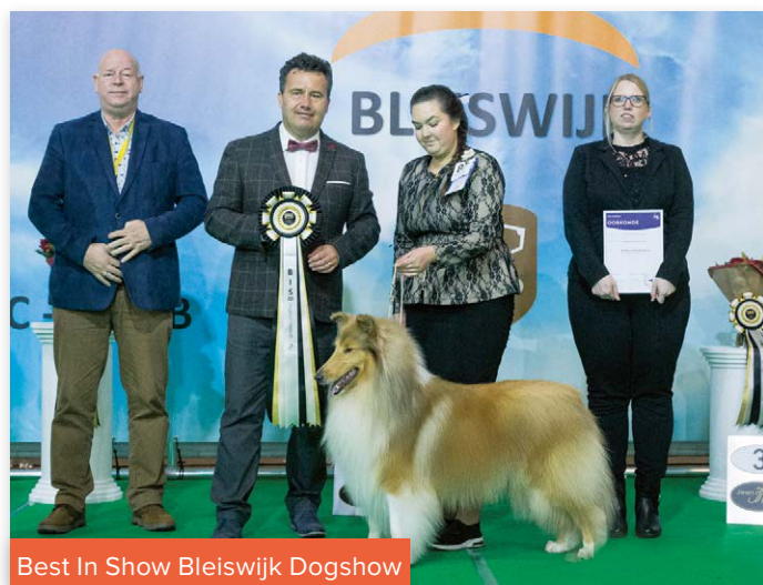
Best In Show Bleiswijk Dogshow